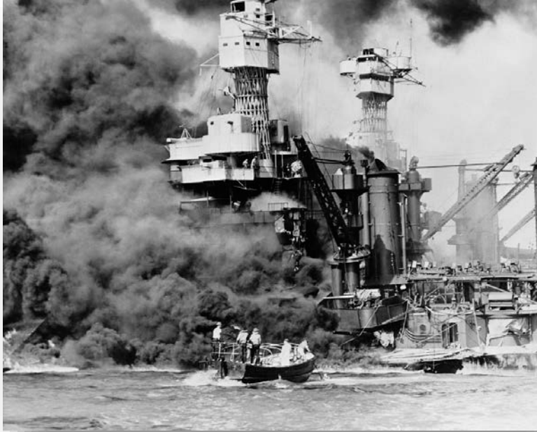
Primary Source: Photograph

The battleship USS West Virginia burning during the attack on Pearl Harbor.