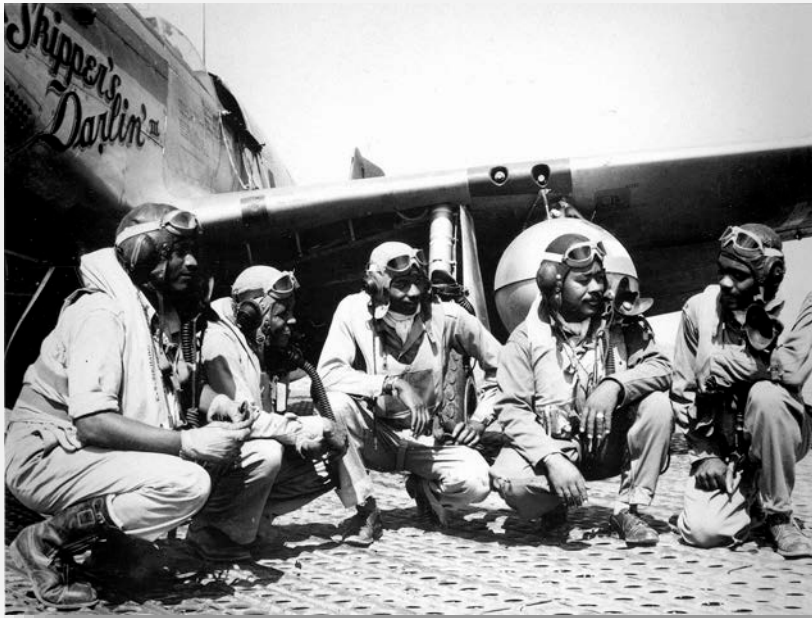
Primary Source: Photograph

고안하기보다는 모국어(를) 사용함으로써 예기치 못한 곳에서 큰 기여를 할 수 있다고 시연했습니다.