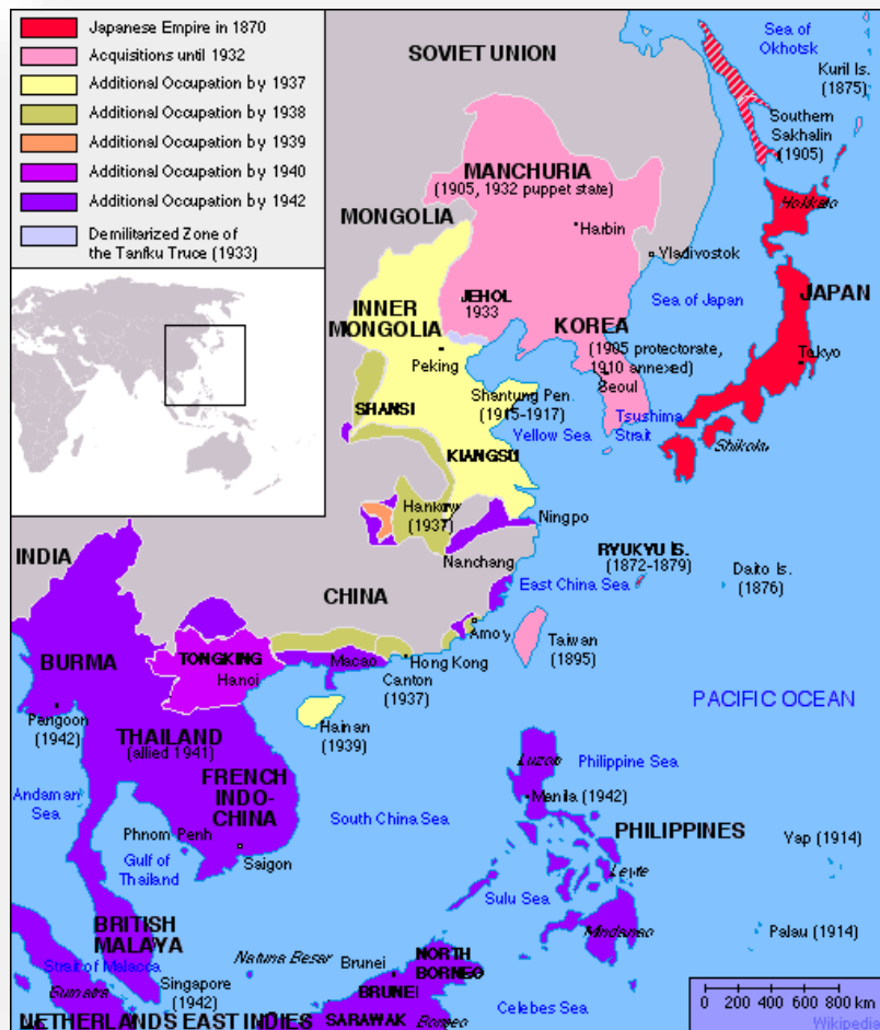
Secondary Source: Map

그것을 만주국이라고 불렀다. 국제 연맹 (League of Nations)이 공식적으로 일본의 중국 영토 발작에 항의했지만, 다른 어떤 조치도 취하지 않았습니다. 히틀러가 유럽에 진출한 것과 마찬가지로 영국, 프랑스 및 다른 리그 회원국들은 중국의 한 구석을 보호하기 위해 일본과 전쟁하기를 원치 않았다. 공식 미국의 반응은 Stimson Doctrine 으로, 일본이 불법적으로 점령 한 지역을 인정하지 않았다. 미국인들이 일본의 팽창에 대한 불만을 보여주기 위해 만든 일련의 움직임 중 첫 번째 단계 였고, 결국 일본 정부가 미국을 공격하게 만들었다.